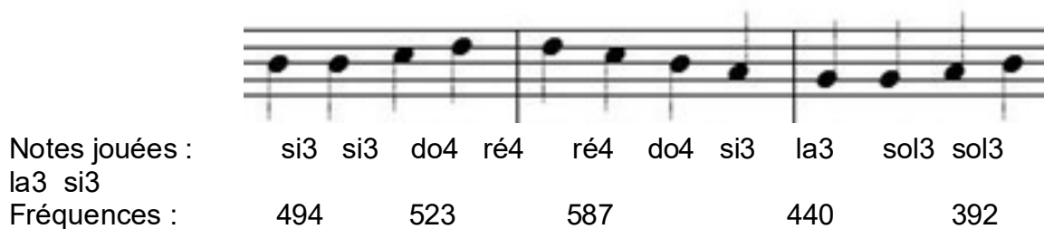
Figure 1a : Extrait de la partition de la neuvième symphonie et fréquences des notes jouées